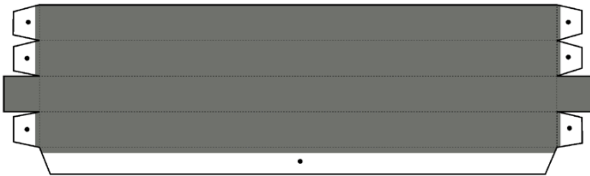
partes para el marco