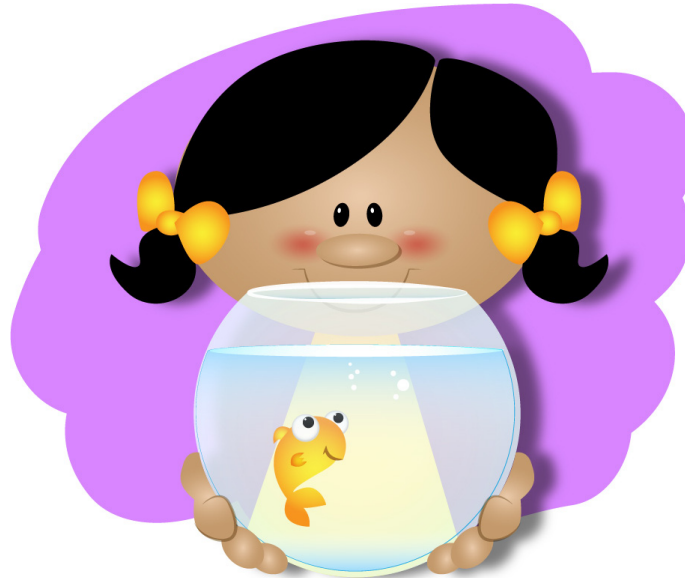
ペットを か 飼う