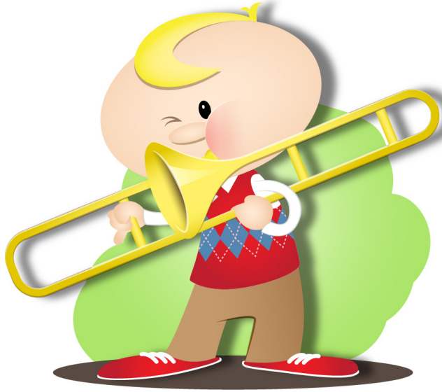
がっ き えんそう 楽器を 演奏する

きみ 君が 何か すごく やってみたいって おも 思っていることは、 なに 何かかな?