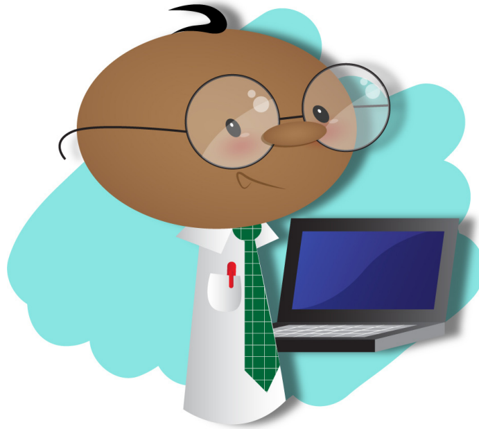
コンピューター・プログラマー