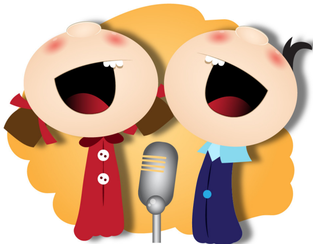
うた ひと 歌って 人を はげます