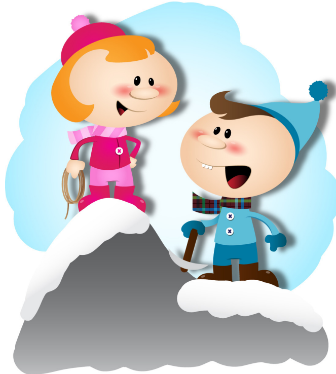
やま のぼ 山を 登る