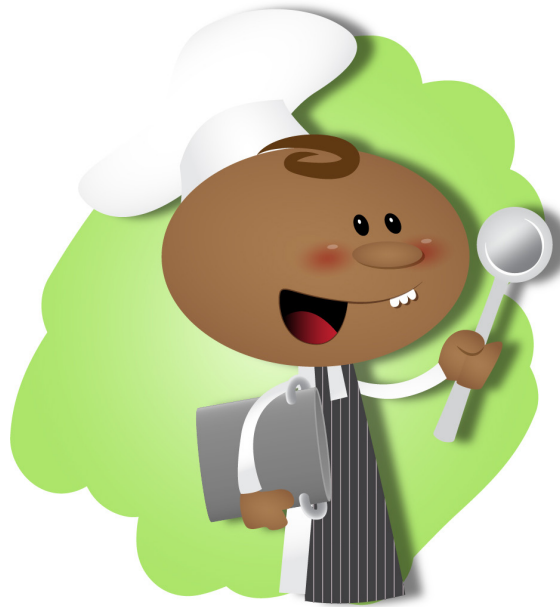
りょうり 料理のシェフ