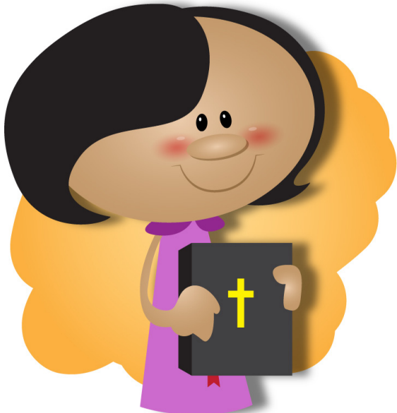
せんきょうし 宣教師