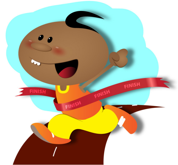
きょうそう か 競争で 勝つ