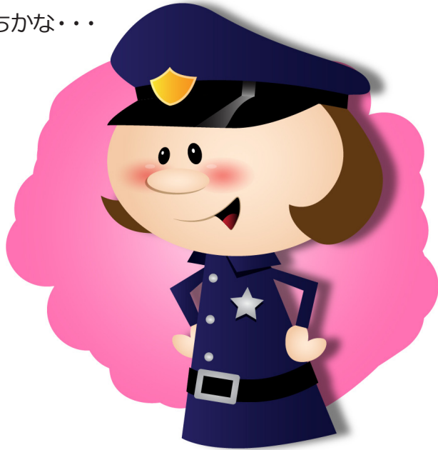
けいさつかん 警察官